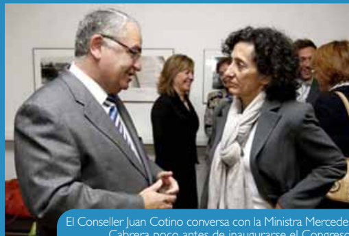
El Conseller Juan Cotino conversa con la Ministra Mercedes Cabrera poco antes de inaugurarse el Congreso.