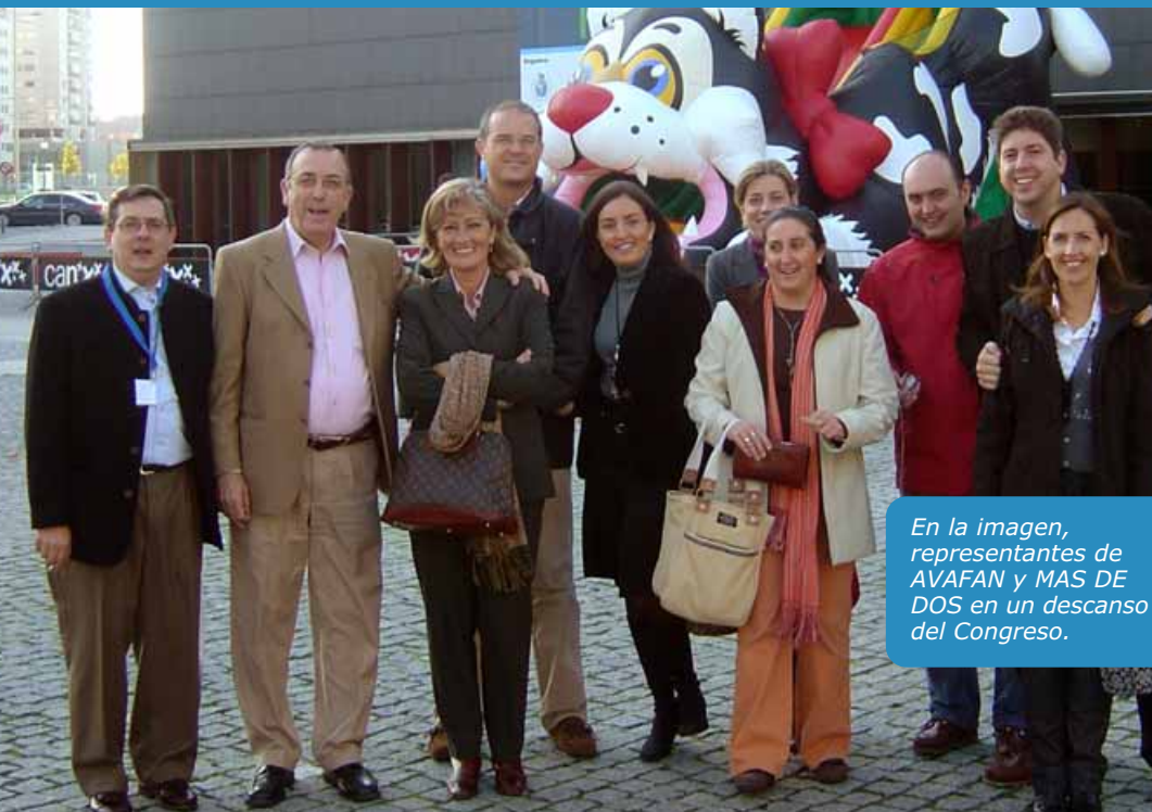
En la imagen, representantes de AVAFAN y MAS DE DOS en un descanso del Congreso.